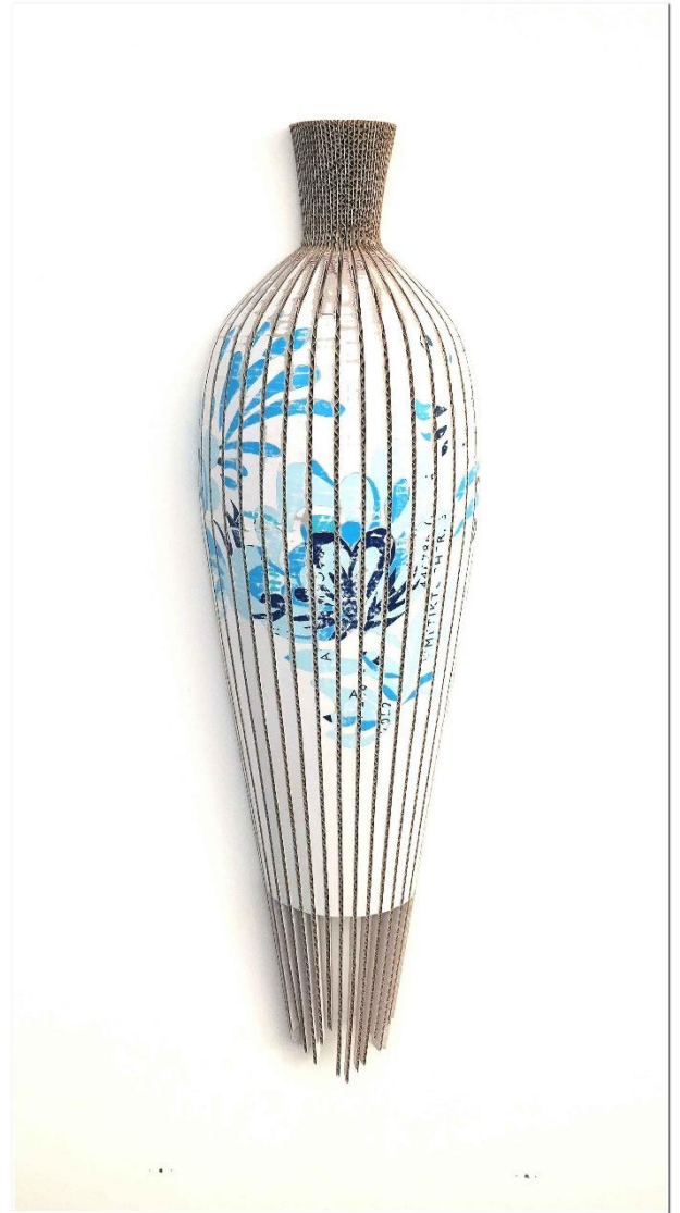
Roswitha Berger-Gentsch, WANDOBJEKT II, Kartonage