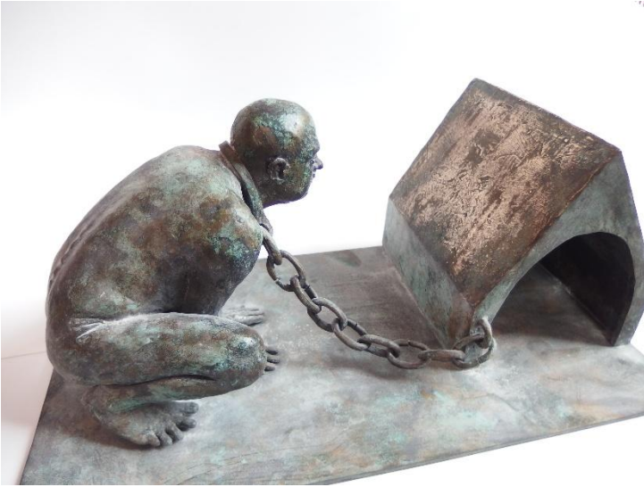
Adelbert Heil, SURFDOG, Bronze