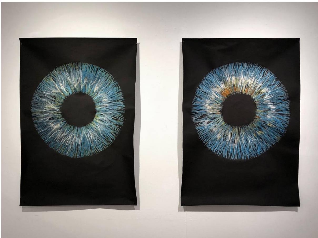
Michaela Schwarzmann, Erkenne dich selbst , Buchbindeleinen und Faden, 100 x 70 cm zweiteilig, 2020.

Neben dem Herzen sind es vor allem die Augen, die den Blick in die Seele eines Menschen ermöglichen. Michaela Schwarzmanns Arbeit Erkenne dich selbst verwendet das menschliche Auge als Bildmotiv ihrer inhaltlichen Auseinandersetzung mit dem Thema SELBST . Mit bunten Fäden auf schwarzes Leinen genähte Linien verbinden sich zu einem individuellen Irismuster. Die Regenbogenhaut des Menschen bildet die Grenze zwischen Innen und Außen, auf dem Weg zur Selbsterkenntnis muss man zur sichtbaren Außenwelt in Distanz treten, um Zugang zur inneren Welt zu finden, wo sich objektive und subjektive Eindrücke überlagern und die individuelle Psychologie jedes Menschen herausbilden. Benannt ist die Regenbogenhaut nach Iris, der Göttin des Regenbogens in der griechischen Mythologie. Als Botin von Zeus und seiner Frau Hera verließ Iris den Olymp nur, um der Menschheit die göttlichen Befehle zu überbringen. Die Iris macht jeden Menschen unverwechselbar und ist so einzigartig wie sein Fingerabdruck, das Scannen der Iris dient auch als Zugangscod für private oder geheime Daten. Das Geheimnis, das sich hinter der Iris verbirgt, wird so zugleich zur Metapher für die unergründliche innere Welt des Ichs.