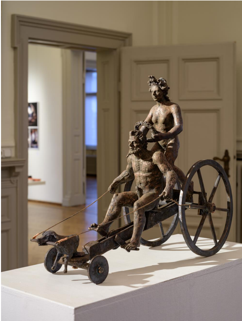
Adelbert Heil, Peter Maser's Fahrzeug II , Bronze, 2020.

Wirkungen erst im 19. und 20. Jahrhundert entfalten sollten. Adelbert Heil sieht in der Erfindung Peter Masers einen Vorboten der Epoche des Automobils, einhergehend mit seinem Aufstieg zum kollektiven Symbol der Selbstwahrnehmung und den damit verbundenen gesellschaftlichen Veränderungen. Für das Ausstellungsthema SELBST schuf Heil deshalb eine 5-teilige Serie aus Bronzeskulpturen mit dem Titel Ich bin nicht Peter Maser . Der griechischen Mythologie entsprungene Figuren, inspiriert durch barocke Skulpturen im Garten von Schloss Seehof bewegen sich wie in einem Streitwagen auf einer Art Tretauto fort, das Spekulationen über die Zukunft muskelbetriebener Fahrzeuge auslösen kann.