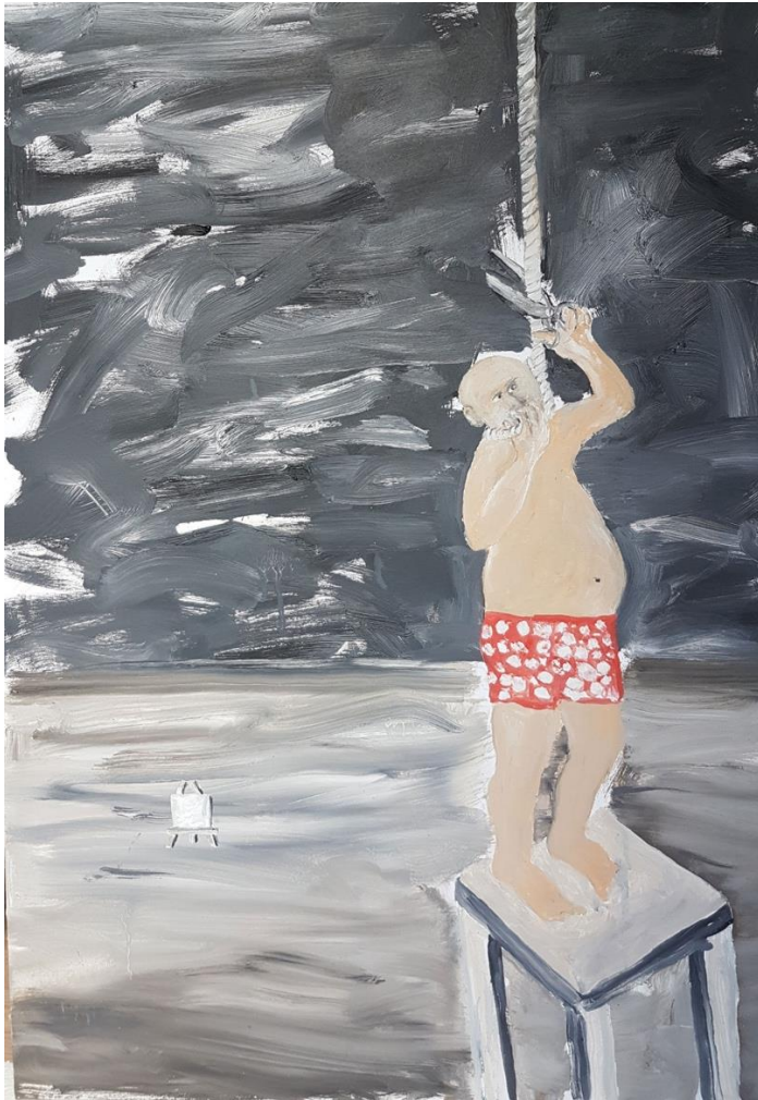
Gert Ressel, Der Versager , 100x70cm, Öl auf Leinwand, 2020.

und Attitüden aufs Korn, dem hintergründigen Witz Martin Kippenbergers zur Ehre reichend. Meistens handeln seine Bilder von den Allmachtsfantasien des Künstlers, die in eine Chronik des Scheiterns münden. Seine Protagonisten sind getrieben von narzisstischer Selbstbespiegelung, um im Fegefeuer der Eitelkeiten vergeblich auf die Erlösung durch die Kunst zu warten. In seinem Bild 4 Beispiele schlürft der Idiot Farbe, um Aufmerksamkeit zu erzeugen, anstatt zu malen. Wie Pygmalion schafft der Maler in Die Unvollendete die Frau mit leichter Hand, halb unter dem Tisch beobachtet er die „allmähliche Verfertigung“ seiner Idee. Ein Malgott. Oder der Malerfürst, der in Anlehnung an das berühmte Zitat von Ludwig XIV. L'état, c'est moi die Inschrift L'art, c'est mo... auf eine Wand pinselt. Der letzte Buchstabe fehlt noch, ob ein moi oder ein mort daraus wird, ist offen. Angesichts seines uninspirierten Versagens bleibt dem Maler am Ende nur der Strick, doch auch hier versagt er.